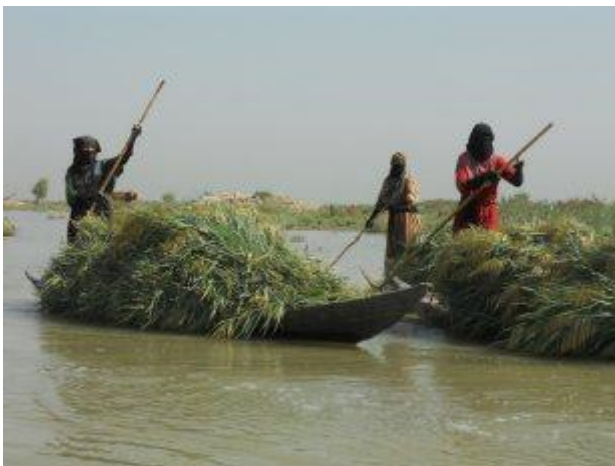
Ilustración 2: Arabes de los pantanos del sur de Iraq

El Proyecto Ilisu está situado en la Mesopotamia superior, la "cuna de la civilización", cuna de los primeros asentamientos humanos. El Proyecto Ilisu afectaría a más de 400 sitios arqueológicos - toda el área afectada aún no ha sido examinada completamente. Hasta la fecha solo se han realizado excavaciones en alrededor de 20 sitios. El pueblo de Hasankeyf que sería inundado por el embalse de Ilisu, de 12.000 años de antigüedad, combina de manera única un rico patrimonio cultural con un importante entorno biológicamente diverso. Esto es también debido a que ha sido habitada ininterrumpidamente. Por eso Hasankeyf se ha convertido en el símbolo de la lucha contra el Proyecto Ilisu. Hasankeyf se encuentra en la histórica Ruta de la Seda, y fue una de las ciudades regionales más grandes en la época medieval, e incluye trazas de 20 culturas distintas, orientales y occidentales, varios cientos de monumentos y hasta 5.500 cuevas excavadas. Es un área extensa y precisa una excavación meticulosa de decenas de años. Hasankeyf y la zona que adyacente al valle