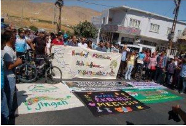
Ilustración 8: 1er Día de Acción Global de Hasankeyf, 20.09.2015, Hasankeyf