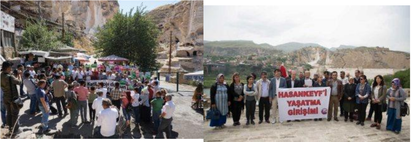
Ilustración 10: días de acción para Hasankeyf, 2017 y 2018, fuente: HYG

Desde 2012, Hasankeyf Matters ( www.hasankeyfmatters.com ), un grupo de voluntarios de Estambul y Batman, está involucrado en la campaña. Se centra en la conservación del patrimonio cultural de Hasankeyf. En 2015, el Movimiento Ecológico de Mesopotamia, un nuevo movimiento amplio de activistas y organizaciones con orientación ecológica en el Kurdistán bajo dominio turco, se unió a la campaña contra el Proyecto Ilisu. Solo en 2015, se organizaron más de cinco manifestaciones junto con HYG, dos de ellas en Dargecit, la ciudad contigua a la represa.