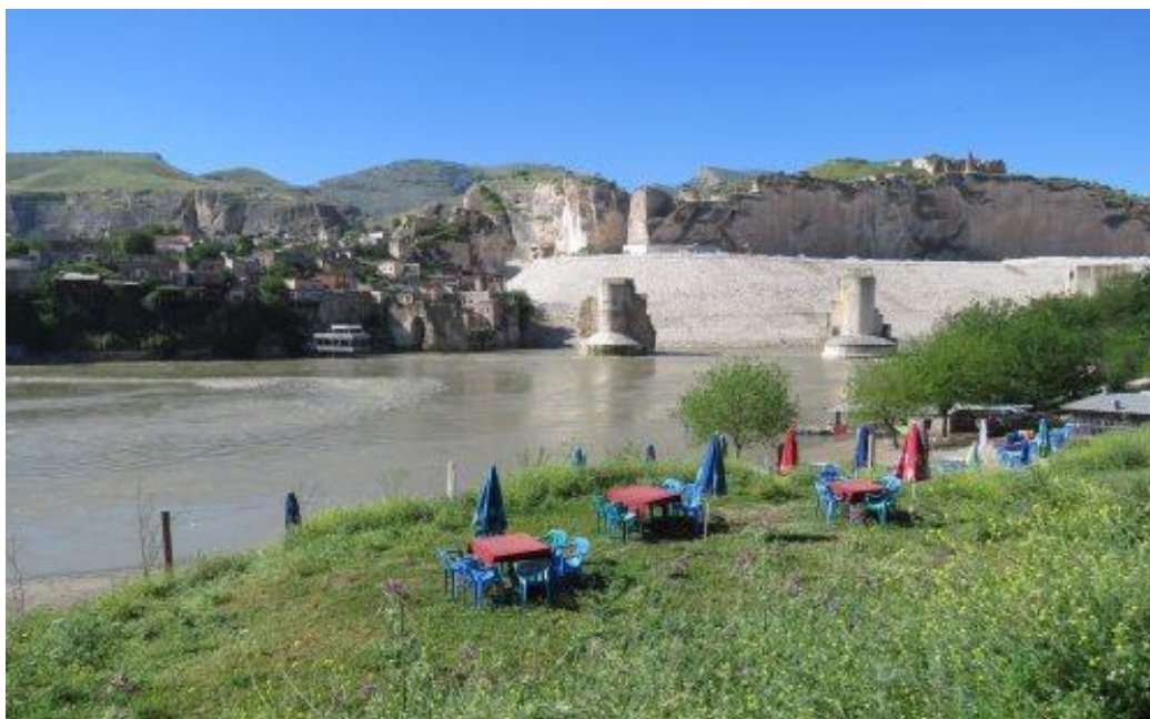
Ilustración 7: La nueva presa alrededor de la Roca del Castillo