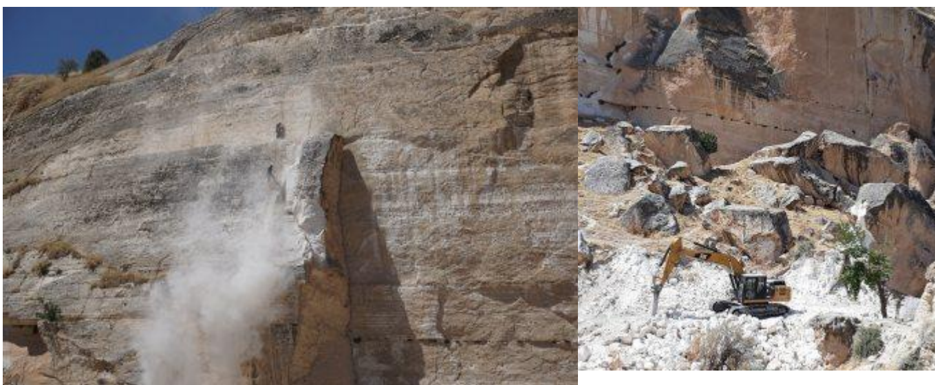
Ilustración 6: Destrucción de una pieza de roca a mediados de agosto de 2017; Equipo pesado trabajando con escombros

El reclamo oficial de rescatar a Hasankeyf consiste principalmente en la reubicación de siete