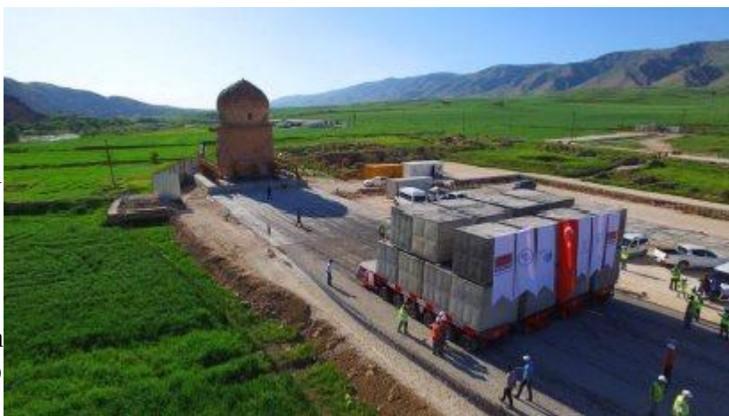
Ilustración 5: Mausoleo de Zeynel Bey durante la reubicación en mayo de 2017

Sin embargo, la situación explotó en 2018. A fines de 2017, los funcionarios del gobierno anunciaron que los dueños de las tiendas de Hasankeyf deberían mudarse a los nuevos edificios de tiendas construidos en Nuevo Hasankeyf en marzo de 2018, mientras los habitantes aún vivían en Hasankeyf. Debido a que las nuevas casas en Nuevo Hasankeyf estaban lejos de completarse, los dueños de las tiendas y los familiares organizaron la esperada protesta. Aunque portaban