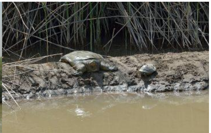
Ilustración 3: Tortuga de caparazón blando