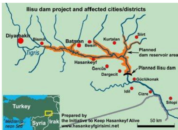
Ilustración 1: imagen 1: Mapa del área afectada por el Proyecto Ilisu; fuente: Iniciativa para mantener Hasankeyf Viva (HYG)

El primer Consorcio Ilisu colapsó en 2002, pero fue recuperado en 2005 con la participación de empresas alemanas, suizas y austriacas que solicitaron garantías de crédito a la exportación en sus estados. En los años siguientes, la implicación de empresas europeas, bancos y los gobiernos fue muy disputada hasta que, en julio de 2009, las Agencias de Crédito a la Exportación (ECA) de Alemania, Austria y Suiza dieron un paso sin precedentes y ordenaron la suspensión de las garantías de crédito, en base a la falta turca de cumplir con las requeridas condiciones ambientales, sociales y culturales (patrimonio), y gracias a una fuerte campaña internacional de protestas. Sin embargo, el gobierno turco organizó nuevas financiaciones con préstamos de tres bancos (uno de ellos el Guaranti, perteneciente a BBVA) y comenzó la construcción del proyecto en marzo de 2010. En el consorcio Ilisu se mantuvo una sola empresa internacional: Andritz de Austria.