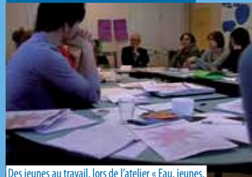
Des jeunes au travail, lors de l'atelier « Eau, jeunes, citoyenneté ». Du 15 au 20 décembre 2011 à Nanterre.

De retour du Forum alternatif mondial de l'eau, 20 jeunes étudiants nous invitent au débat. Projection du reportage réalisé lors de l'atelier « Eau, jeunes, citoyenneté » organisé dans le cadre de la préparation du FAME, du 15 au 20 décembre 2011 à Nanterre. Rencontre avec les participants à cet atelier.